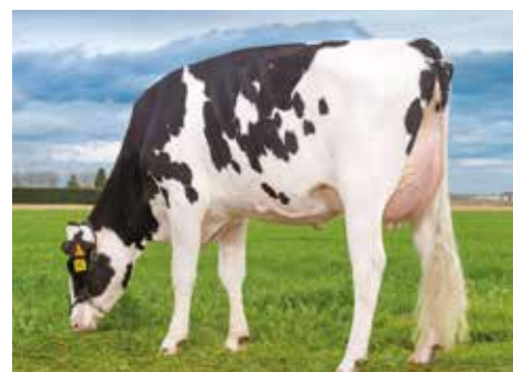
Ansal Hotrod 460