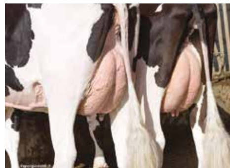
Barbiselle Spring 306 & 351

In deze fokwaardeschatting optimaliseerde het Amerikaans stamboek het rekenmodel voor duurzaamheid (PL) en dochtervruchtbaarheid (DPR). Hierdoor kregen alle Amerikaanse Holstein- en Jerseystieren een lagere fokwaarde voor PL en DPR en dus ook een lagere TPI-fokwaarde. Slechts het rekenmodel werd aangepast en geldt voor alle stieren in de sector. De genetische aanleg van deze stieren blijft onveranderd.