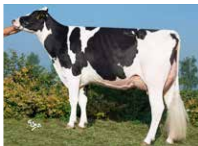
Bomaz Spring 6901 Bomaz Farms; Hammond, WI